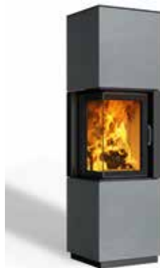
Minh 38 Beton hell