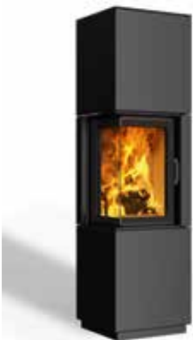
Minh 38 Stahl