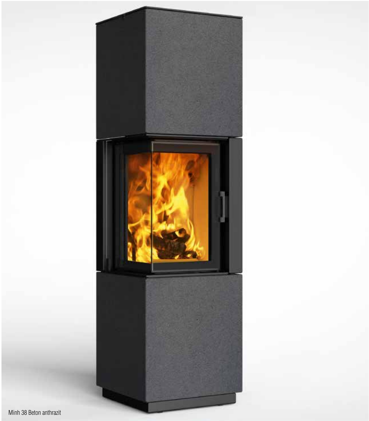
Minh 38 Beton anthrazit