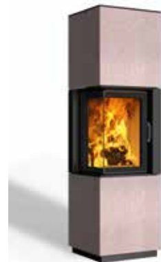
Minh 38 Beton terra