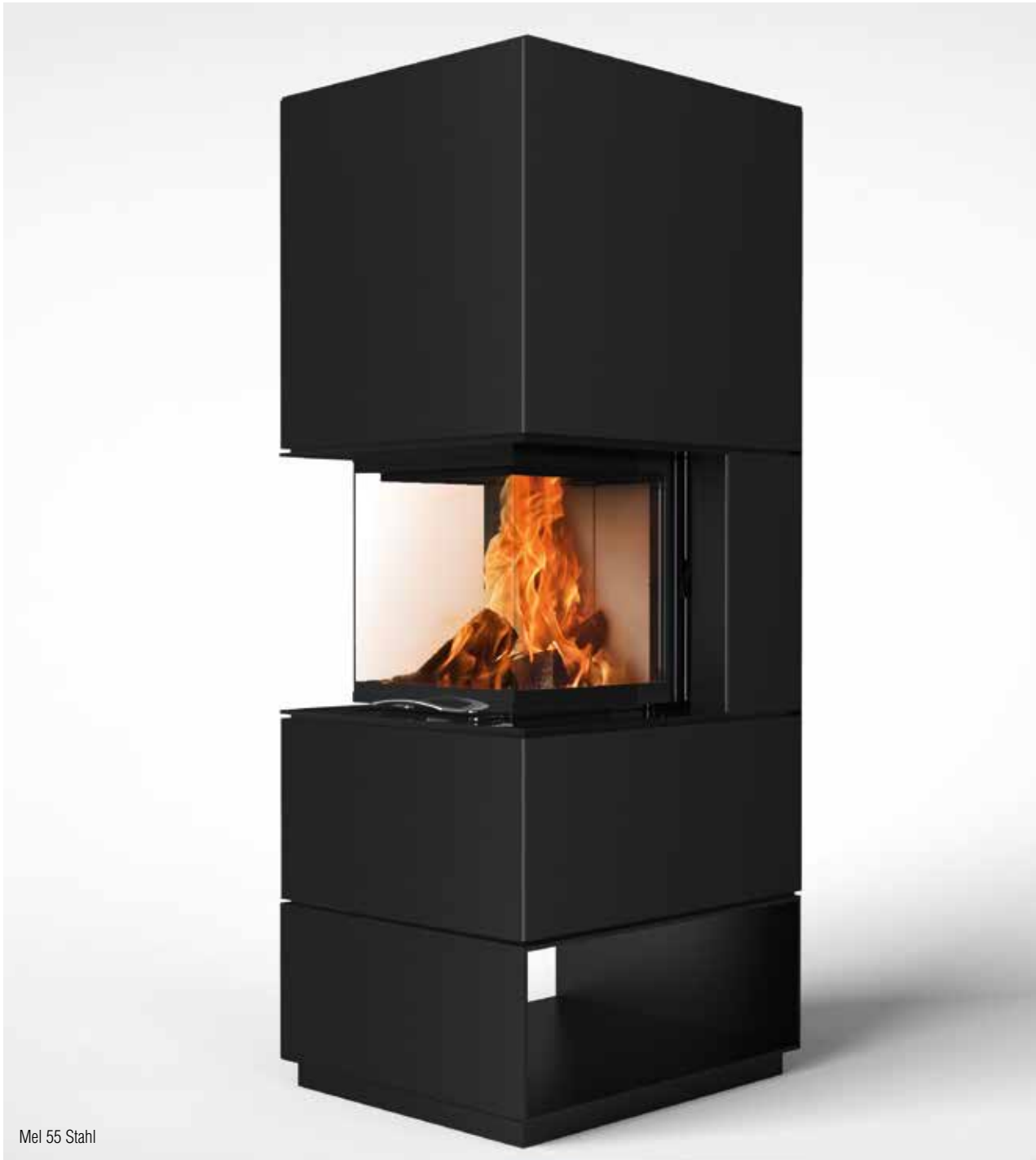
Mel 55 Stahl