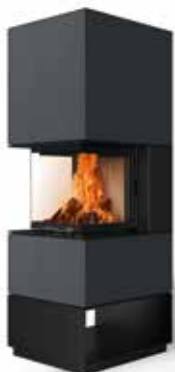
Mel 55 Beton anthrazit