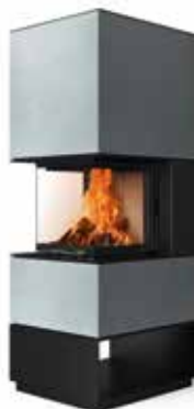
Mel 55 Beton hell