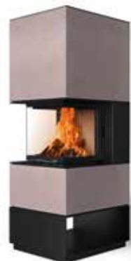
Mel 55 Beton terra