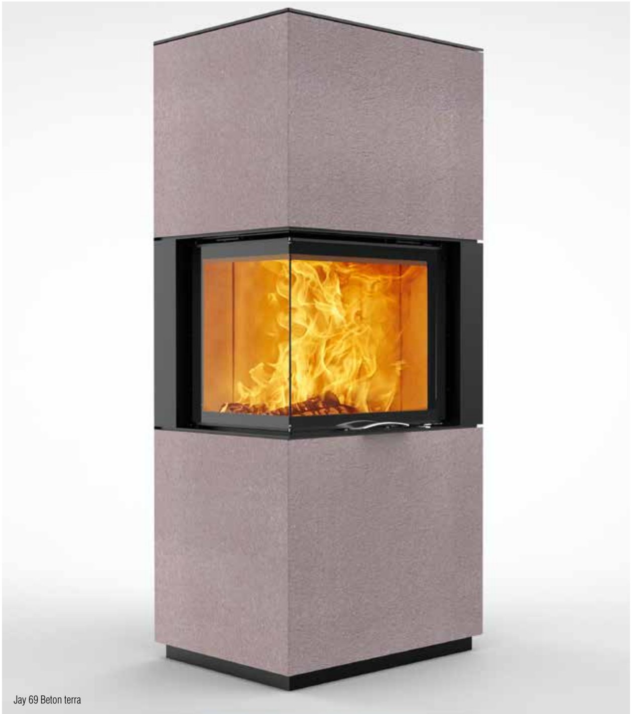
Jay 69 Beton terra