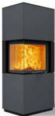
Jay 69 Beton anthrazit