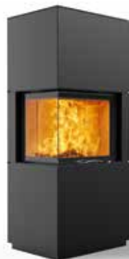
Jay 69 Stahl