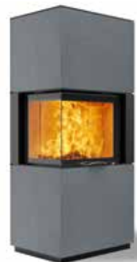
Jay 69 Beton hell