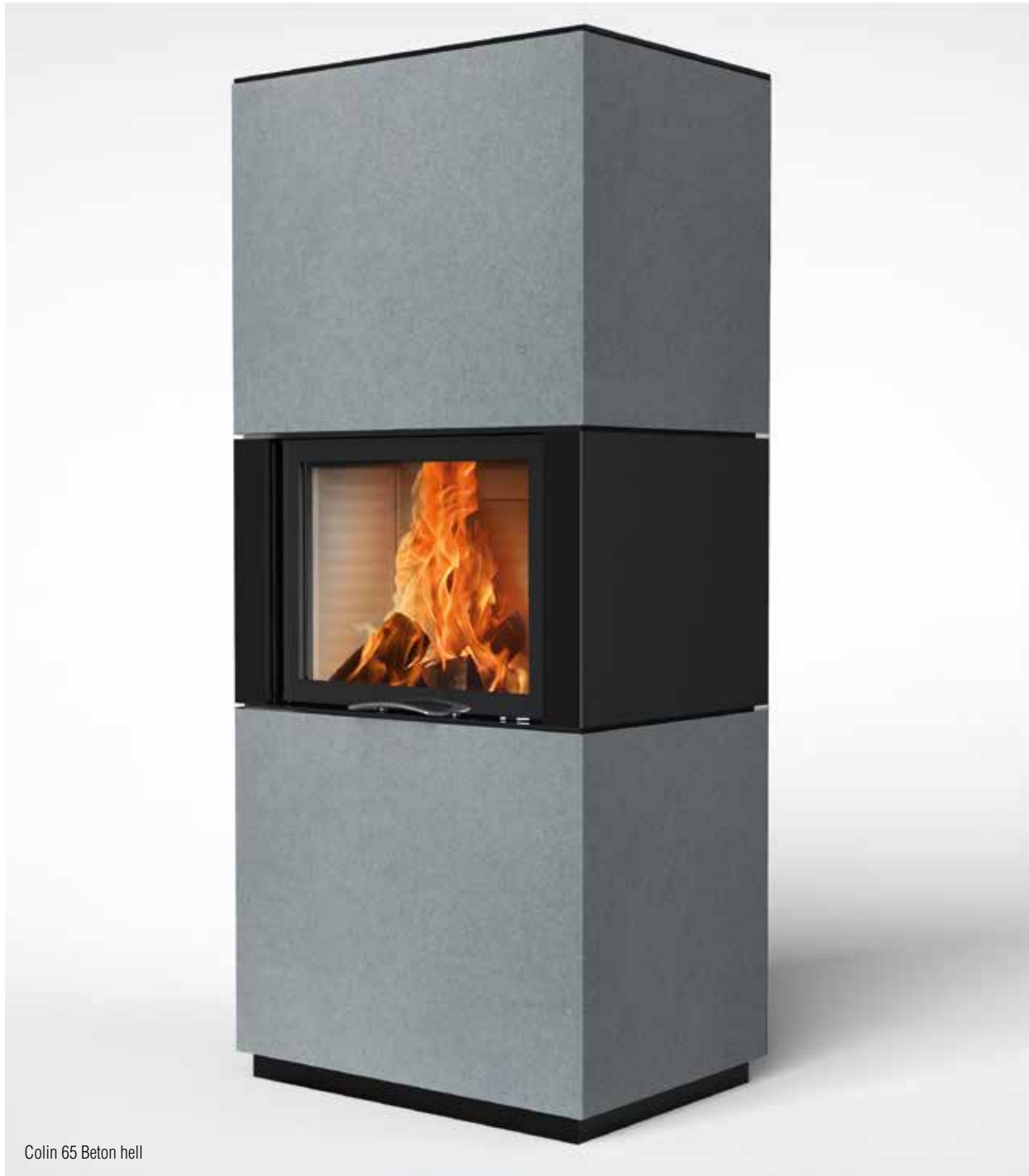
Colin 65 Beton hell