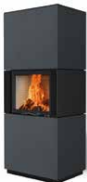
Colin 65 Beton anthrazit