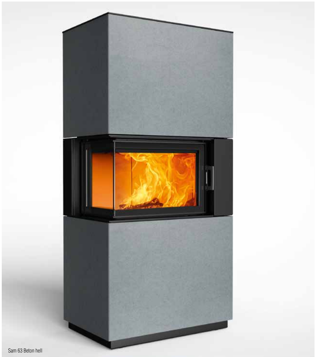
Sam 63 Beton hell