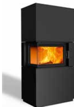
Sam 63 Stahl