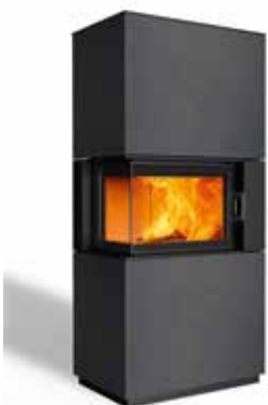
Sam 63 Beton anthrazit