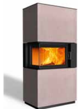
Sam 63 Beton terra