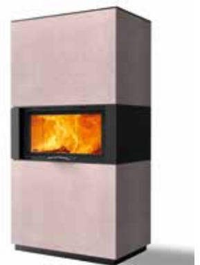
Rikk 75 Beton terra