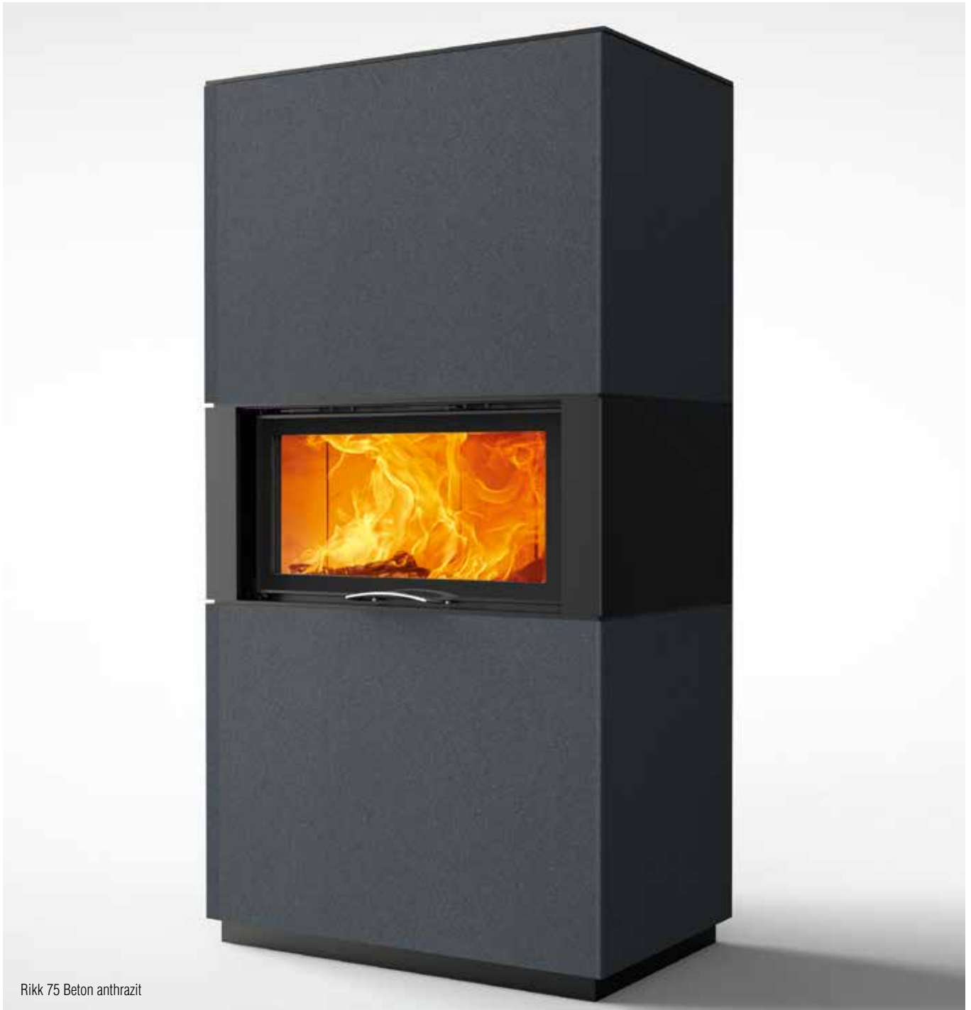
Rikk 75 Beton anthrazit