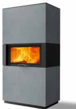
Rikk 75 Beton hell