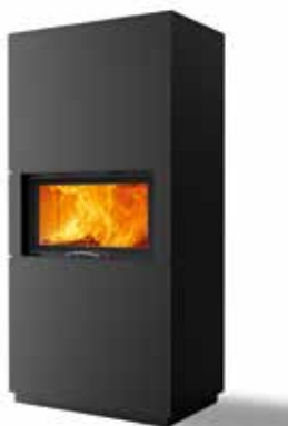
Rikk 75 Stahl