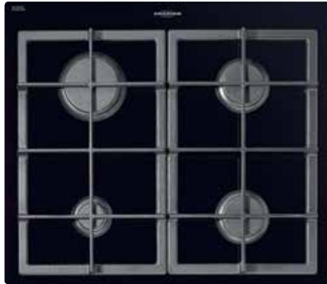
EKG 6 rahmenlos