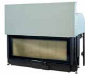
120x45S 2.0 - Art. no. 360149